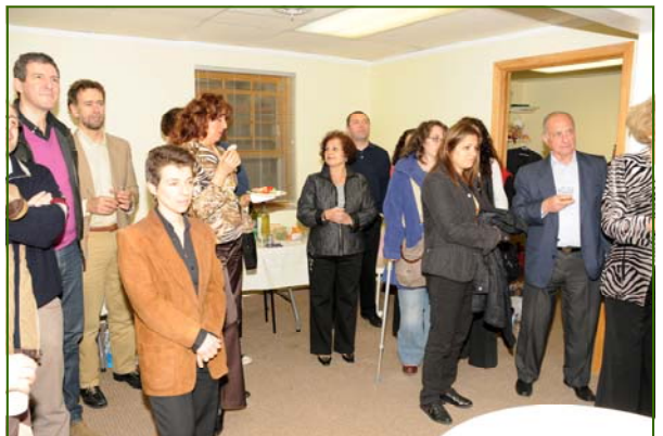
Soci della DAS durante l'inaugurazione.