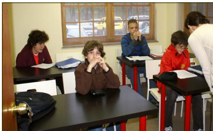
Prima lezione d'italiano presso la sede DAS.