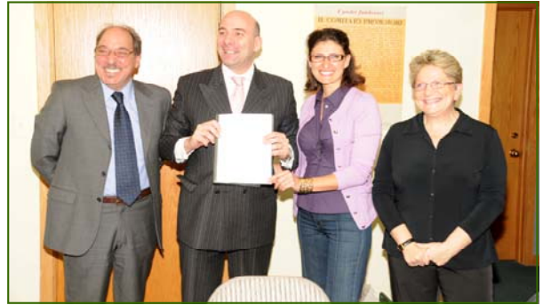
La consegna del contratto di gestione della videoteca.