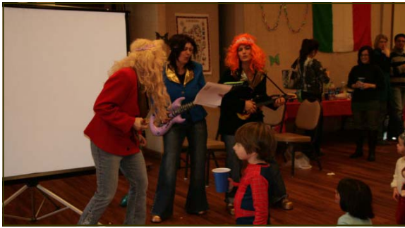
Le cugine di campagna.