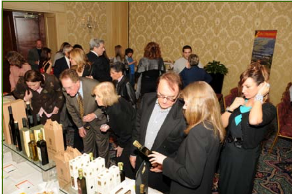
DAS members and friends enjoying olive oil tasting.