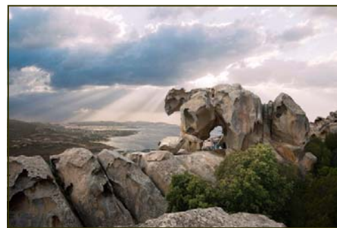
Capo D'Orso - Palau