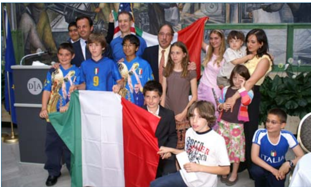
I bambini raccolti dietro la bandiera in posa per le foto.

Potete vedere i video della serata sul website della D.A.S.: dantemichigan.org .