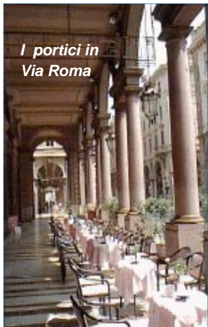
I portici in Via Roma

Non si può parlare del Piemonte senza citare i suoi imprenditori: Ermenegildo Zegna, pioniere della tessitura industriale nel Biellese, Giovanni Agnelli, senatore del Regno e fondatore della FIAT e suo nipote Gianni, che trasformò l'impresa di famiglia nella più importante industria italiana, nonché i visionari industriali eporediesi Camillo Olivetti, padre della macchina da scrivere e suo figlio Adriano, industriale, politico, utopista e promotore del design italiano nel mondo.