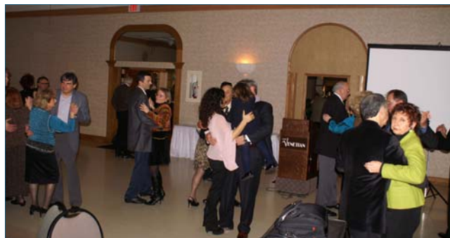
DAS Members and guests ...