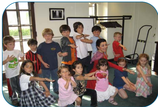
Il gruppo di bambini di Farmington, MI