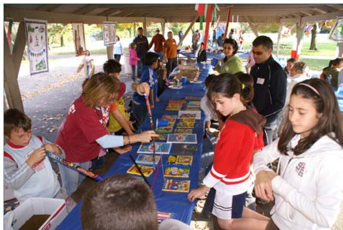
Bambini e ragazzi mentre ricevono materiale didattico per lo studio dell'italiano

La Festa Italiana di Ann Arbor è un evento che ogni anno ci riunisce e ci rafforza, un evento da non perdere per tenere viva la nostra cultura e voglia di socializzare! Vi aspettiamo l'anno prossimo!