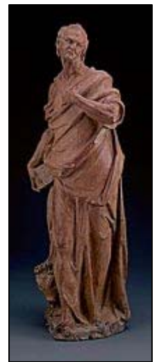
One of the Set of the Four Evangelists: Luke, c.1580