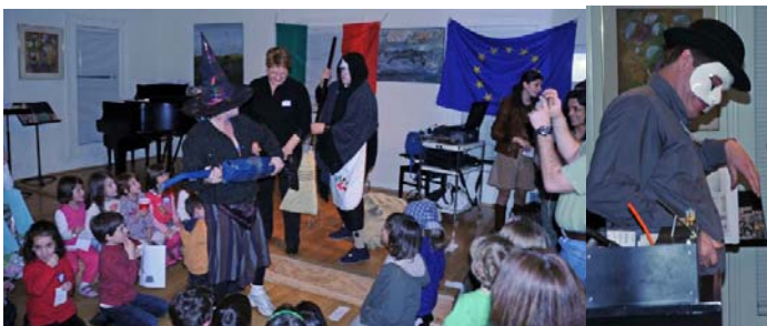
Festa della Befana ad Ann Arbor - 6 gennaio 2008