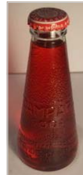
La bottiglia del Campari Soda, disegnata da Depero nel 1928